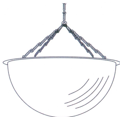
Upphängning med kedja